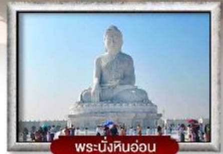
พระนั่งหินอ่อน