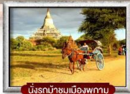
นั่งรถม้าชมเมืองพุกาม