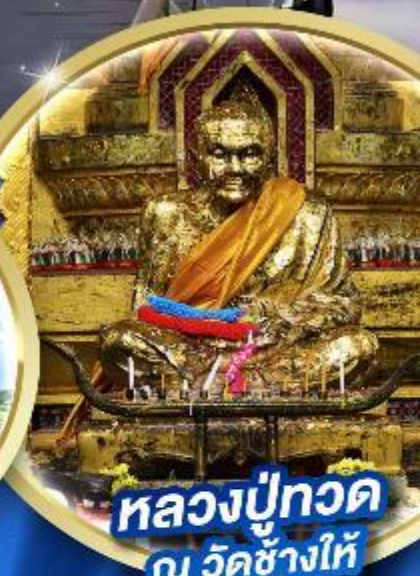
หลวงพ่อทวด ณ วัดช้างให้