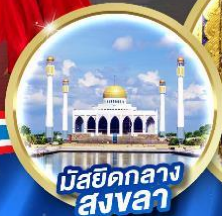
มัสยิดกลาง สงขลา