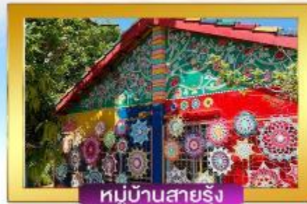
หมู่บ้านสายรุ้ง