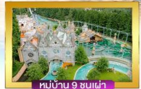
หมู่บ้าน 9 ชั้นเฝ้า