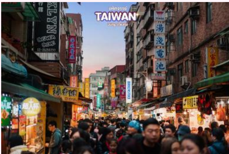
มาตรฐานได้หัวัน

นำท่าน อิสระ ถนนโบราณเต๋นส่วย (Tamsui Old Street) เป็นถนนสายโบราณริมแม่น้ำตันส่วยเมืองแห่งนี้เต็มไปด้วยกลิ่นอายของความเจริญรุ่งเรือง โดยภายในเมืองล้วนมีสิ่งก่อสร้างและอาคารบ้านเรือนในรูปแบบของสถาปัตยกรรมแบบตะวันตกและญี่ปุ่นตอนใต้ ซึ่งริมแม่น้ำสายนี้จะเต็มไปด้วยร้านค้าที่ขายสินค้าพื้นเมืองมากมาย รวมทั้งร้านอาหารท้องถิ่นอีกด้วย